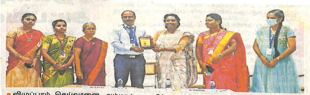
■ விழுப்புரம் தெய்வானை அம்மாள் மகளிர் கல்லூரியில் 'கணித இன்டகரா 10' பேரவை துவக்க விழா நடந்தது.