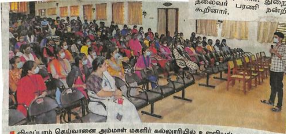
■ விழுப்புரம் தெய்வாணை அம்மாள் மகளிர் கல்லூரியில் உளவியல் துறை சார்பில் காணொலி கருத்தரங்கம் நடந்தது.