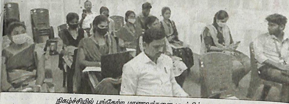
நிகழ்ச்சியில் பங்கேற்ற மாணவர்களை படத்தில் காணலாம்.