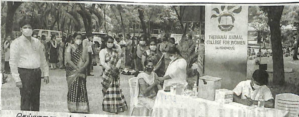
தெய்வானை அம்மாள் மகளிர் கல்லூரியில் மாணவிகளுக்கு கொரோனா தடுப்பூசி செலுத்தப்பட்டது.