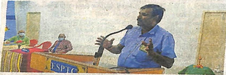
■ விழுப்புரம் இ.எஸ்., பாலிடெக்னிக் கல்லூரியில், வேலைவாய்ப்பு மற்றும் திறனறிவு நிகழ்ச்சி நடந்தது.